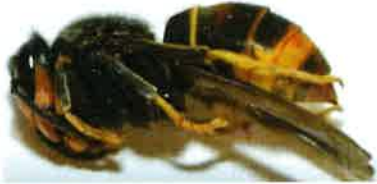
Gyne FA en dormance pendant la phase hivernale