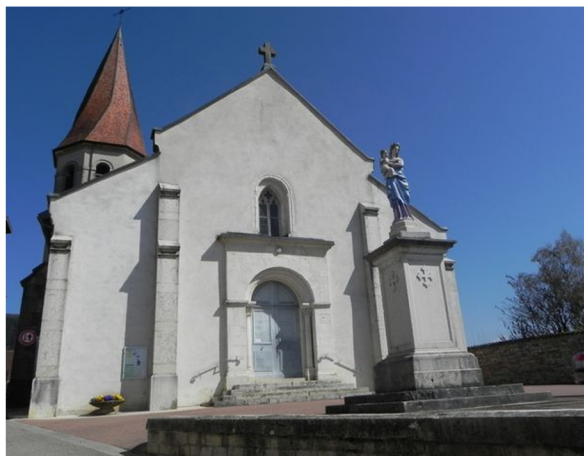
Eglise de Ceyzériat