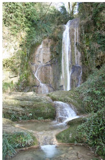
La cascade de la Vallière