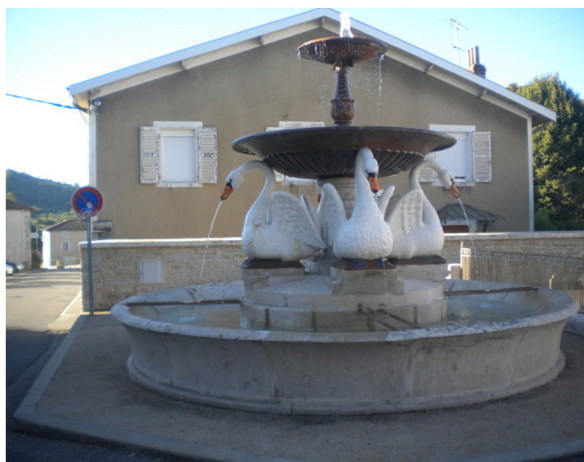
La fontaine des Cygnes